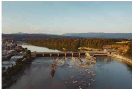
Wasserkraftwerk Rheinfelden