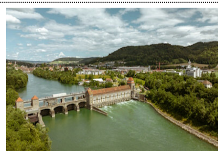
Wasserkraftwerk Laufenburg